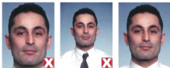
слиш ком близко