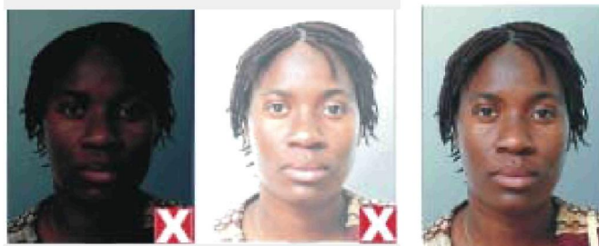
слиш ком темная