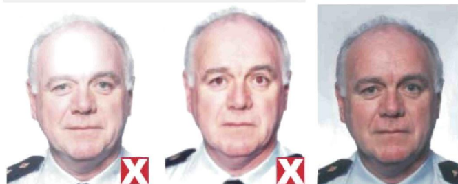
отражение вспышки на лице