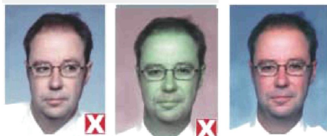
смотрит в сторону