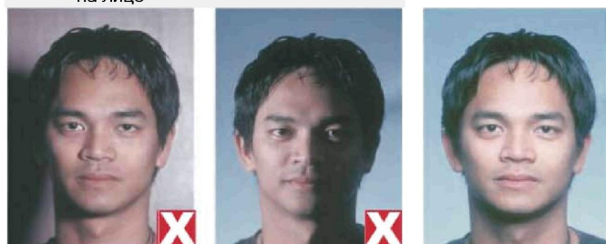
тень позади головы